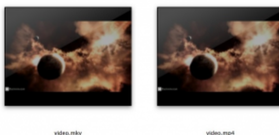
Obr. 2. Video súbory

Ďalšou vecou, ktorá sa pri videách často pletie s formátom, je použitý kontajner. Ako príklad sú na obrázku 2 zobrazené dva video súbory, ktoré obsahujú úplne rovnaký formát videa aj audia, ale ich prípona je rôzna. Tento rozdiel je spôsobený práve použitím rôznych kontajnerov.